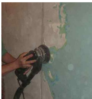
А. Раскрываем поры

1) Подготовка поверхности. Включает откачку воды, выявление очагов протечек (поступления) воды, удаление рыхлого бетона, шлифовку поверхности, нарезку штраб по трещинам;