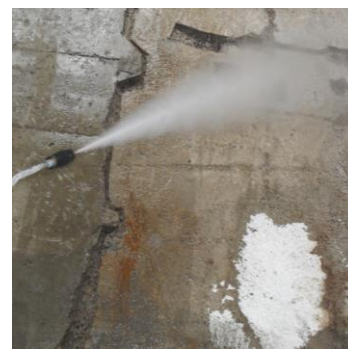
С. Промываем и увлажняем

А. Если планируется сплошная гидроизоляция поверхности, то для удаления цементного молочка и раскрытия пор шлифуем всю поверхность (балгаркой с алмазной чашкой);