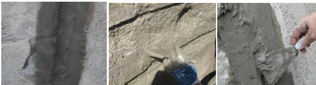
Шаг 1 – Увлажнение

4) Ремонт сколов, выбоин, очагов коррозии, гидроизоляция стабильных примыканий, швов и стыков (в т.ч. стыков стен с полом, между железобетонными изделиями, технологических стыков бетонирования) Дегидролом люкс марки 5 «Ремонтная и проникающая гидроизоляция»(схема 1).