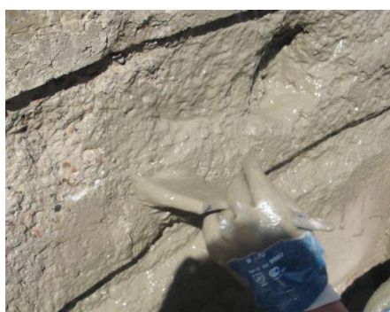
Шаг 2 – Грунтование