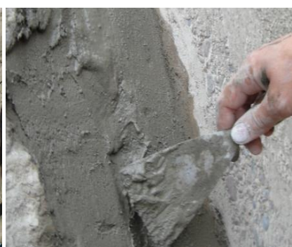
Шаг 3 - Заделка штрабы

- Увлажнение. Всё делаем во влажных условиях! Материал проникающего действия и проникает только в растворенном виде по пропитанным каналам водой в бетоне, то если НЕ увлажнить бетон => деньги на ветер;