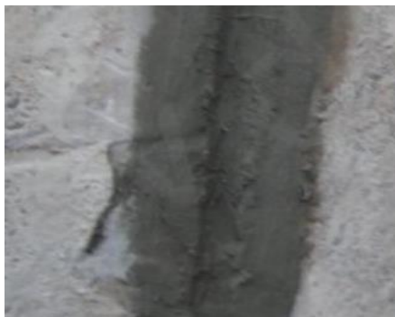
Шаг 1 – Увлажнение