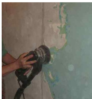
A. Раскрываем поры

1) Подготовка поверхности. Включает откачку воды, выявление очагов протечек (поступления) воды, удаление рыхлого бетона, шлифовку поверхности, нарезку штраб по трещинам;