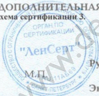
Схема сертификации 3.